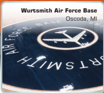
Wurtsmith Air Force Base Oscoda, MI

Escuela Secundaria de San Patricio - Chicago, IL