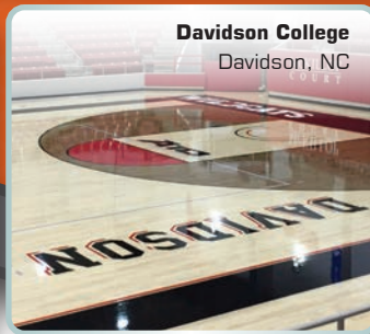
Davidson College Davidson, NC