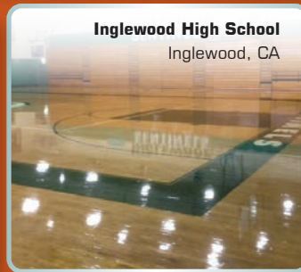
Inglewood High School Inglewood, CA