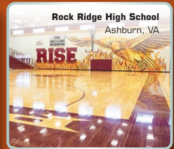
Rock Ridge High School Ashburn, VA